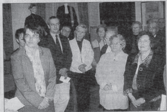
Les élus ont lancé une exposition sur les récompenses scolaires des années 60.

Si la cité des Luthiers a servi de théâtre ce vendredi à une célébration fastueuse du bicentenaire des Palmes Académiques, l'un des points d'orgue de la manifestation a eu lieu dans le cadre du salon d'honneur de la Ville.