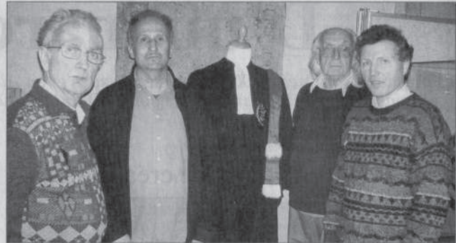
Les membres de l'ordre des palmes académiques et la société d'histoire de Remiremont se sont unis pour cette exposition.

De nombreuses distinctions ont depuis disparu de la circulation et d'autres sont at-