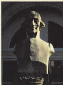
Buste de l'abbé Janny Rue des Prêtres à Remiremont

Société d'Histoire de Remiremont et de sa région 31 rue des Prêtres 88200 REMIREMONT