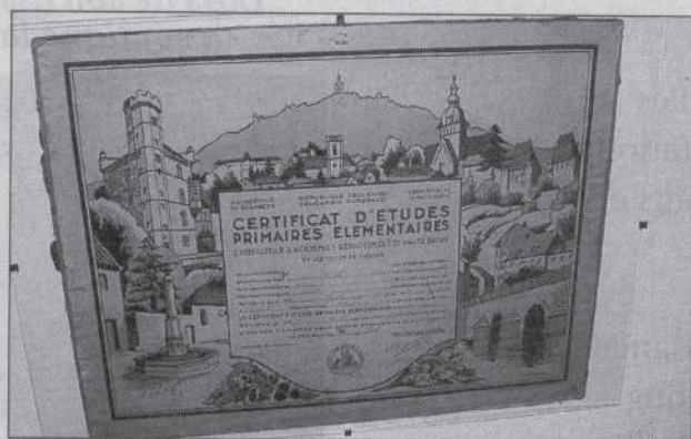
Le certificat d'études primaires, institué en 1866, a été supprimé en 1991. Il était possible de l'illustrer.