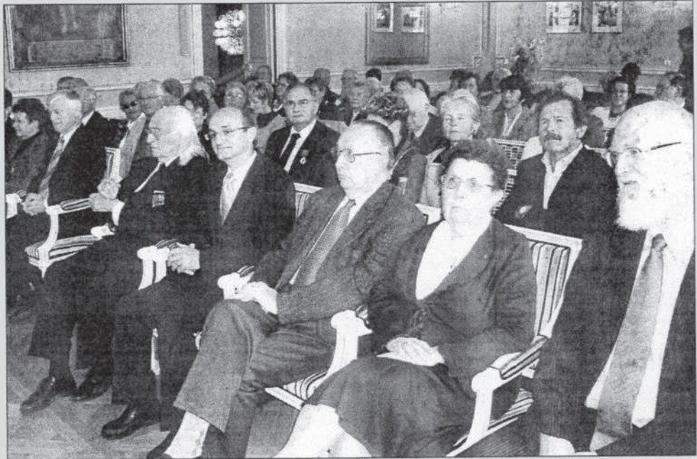
Le grand salon de l'hôtel de ville d'Epinal était comble pour l'ouverture des célébrations qui auront lieu à Saint-Dié, Mirecourt, Remiremont.