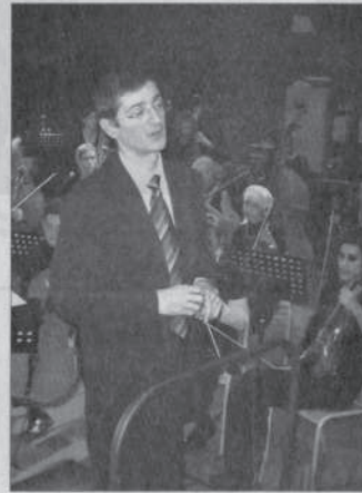
Soixante jeunes de l'orchestre symphonique du conservatoire de Nancy, ont donné un spectacle au Rio.