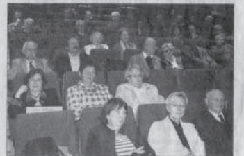
Le public est venu en nombre pour assister à la manifestation.