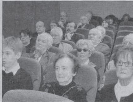
Un public attentif a assisté à la dernière conférence du bicentenaire des palmés académiques.