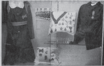
De nombreuses distinctions comme les médailles viennent agrémenter cet événement si original.