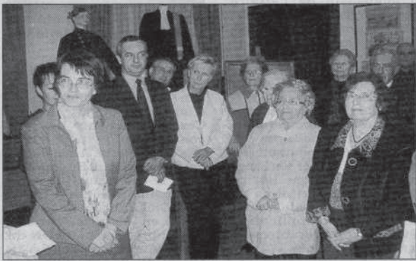
Les élus ont lancé une exposition sur les récompenses scolaires des années 60.

Si la cité des Luthiers a servi de théâtre ce vendredi à une célébration fastueuse du bicentenaire des Palmes Académiques, l'un des points d'orgue de la manifestation a eu lieu dans le cadre du salon d'honneur de la Ville.