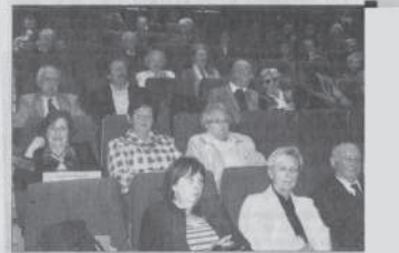
Le public est venu en nombre pour assister à la manifestation.