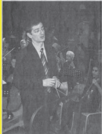
Soixante jeunes de l'orchestre symphonique du conservatoire de Nancy, ont donné un spectacle au Rio.